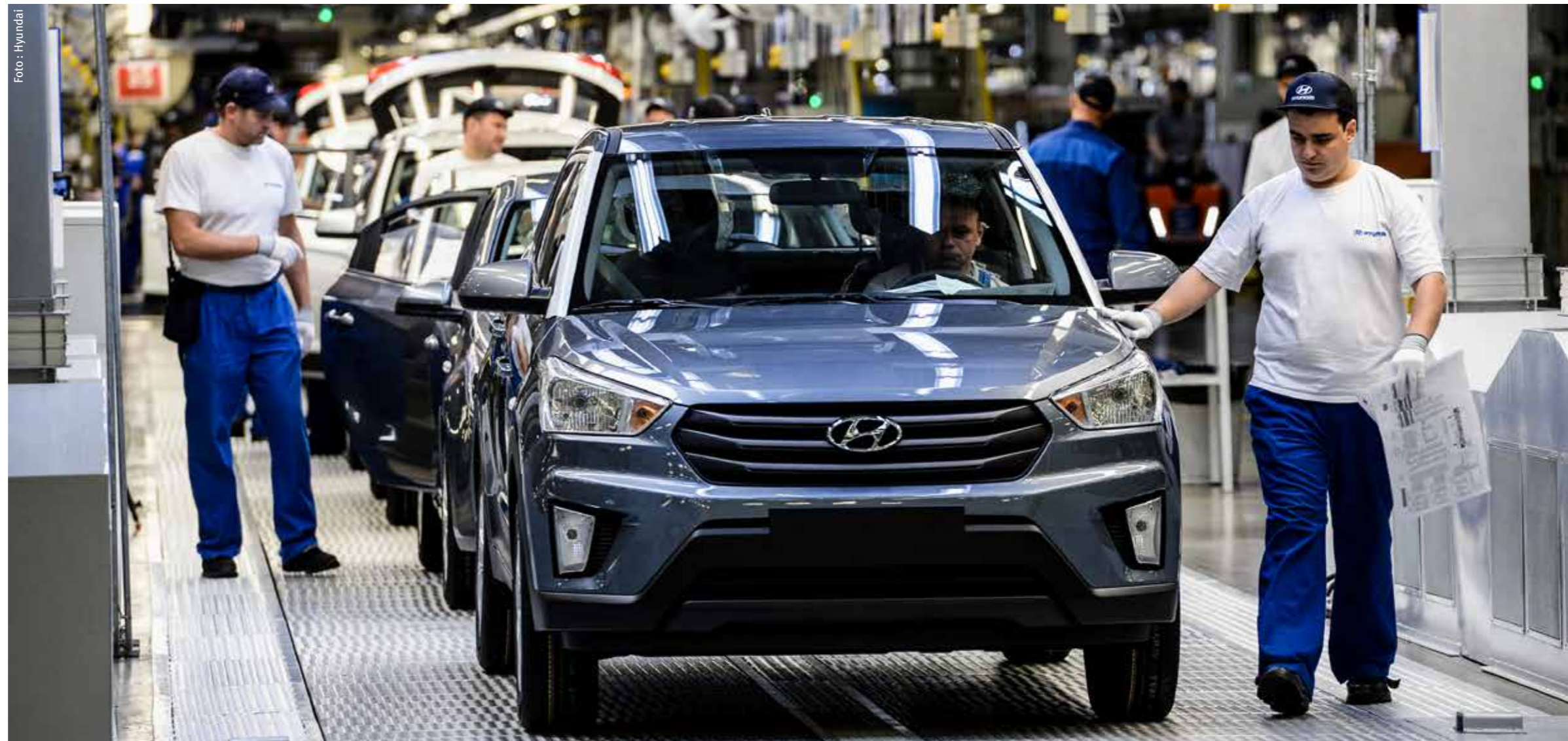
Control de calidad final en una planta de fabricación de automóviles de Hyundai.

Es por eso que Hyundai Motor Company se está centrando en los sistemas de fabricación inteligente. Partiendo de conceptos de productos inteligentes y fábricas inteligentes, forman un entorno de producción en el que los sistemas de producción y logística se organizan sin intervención humana. Es lo que se conoce como un «ecosistema inteligente» y ha sido una gran fuente de satisfacción para Hyundai Motor y nuestros clientes.