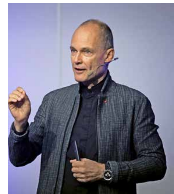
Bertrand Piccard , figura principal de Solar Impulse, habló ante más de 500 delegados en la 41.ª Asamblea General de ISO.