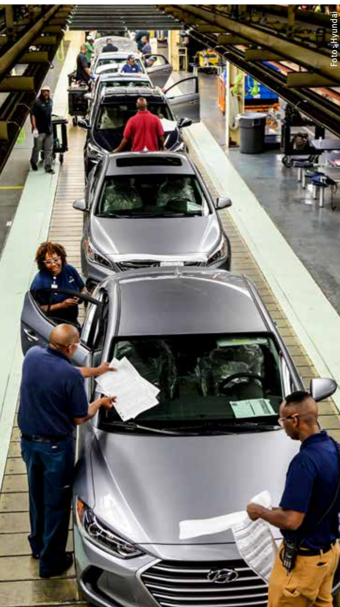
La etiqueta inteligente de Hyundai.